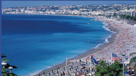
Nice et ses plages

Lieu d'épanouissement de l'art, de la culture et du tourisme, Nice Côte d'Azur est riche d'un extraordinaire patrimoine culturel et artistique. Autant dire que la vie culturelle est intense, rythmée par une programmation éclectique.