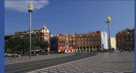
Nice, art et culture