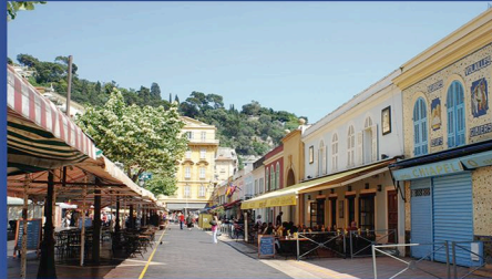
Sortir à Nice